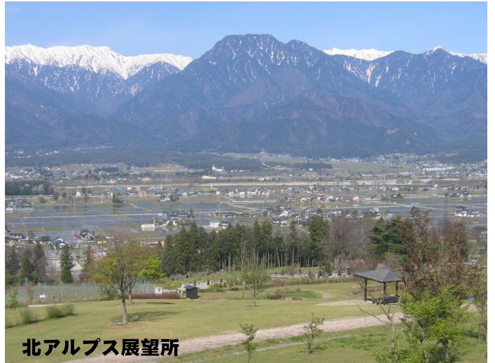
北アルプス展望所