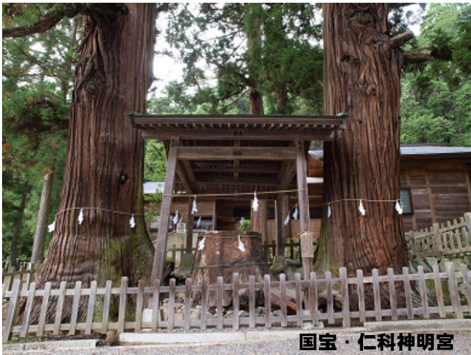
国宝・仁科神明宮